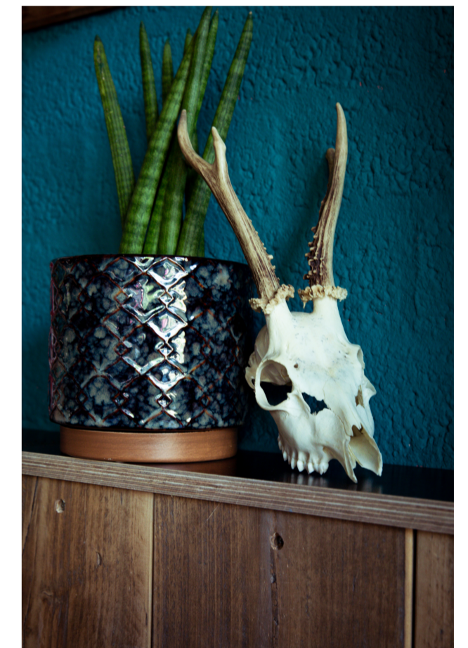
Lambrisering van betonplex

De Broedmachine is een broedplaats van creatieve ondernemers en maakplaats in Beverwijk. Een vereniging waar mensen het hele jaar terecht kunnen om hun eigen ambities waar te maken. De Broedmachine is zelforganiserend en circulair, en werkt met en aan de IJmond.