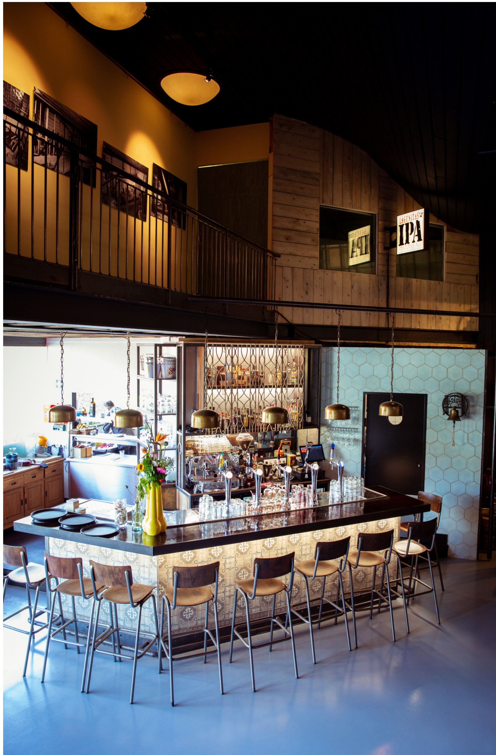
Podiumcafé Toos - Wanden en bar verwerkt met Blok-restmateriaal